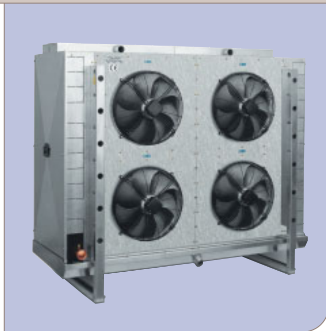
AlfaBlast ABE 502 A7 с водяной системой оттаивания.