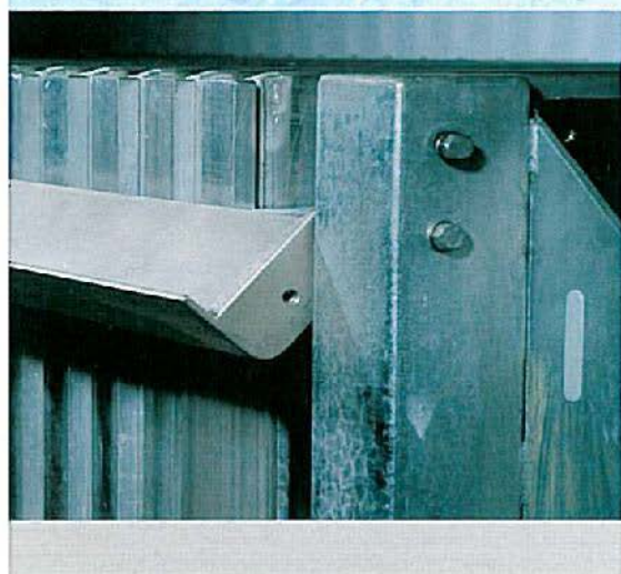
Передняя планка может откидываться для облегчения чистки аппарата