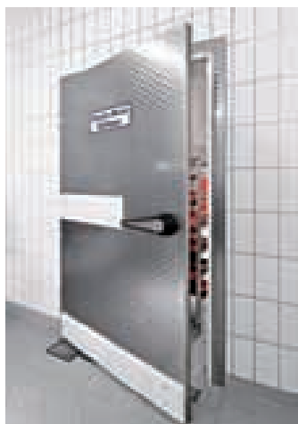
[Abbildung linke Seite] • KTS-T90 Brandschutz-Schiebetür, Oberfläche V2A Längsschliff